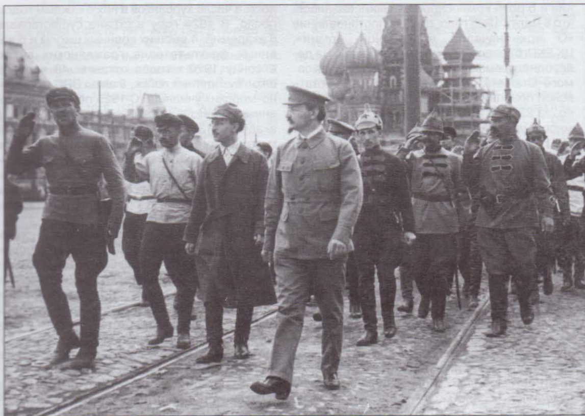
Председатель РВС Республики Л.Д.Троцкий во время перламутрового парада на Красной площади. Начало 20-х годов.

ской борьбой и личными взаимоотношениями. Наряду с территориальной системой партийным деятелям очень нравилась идея создания национальных формирований 12 . Потратили десятки миллионов рублей, прежде чем поняли, что создание грузинской, украинской и прочих красных армий обходится слишком дорого и является миной замедленного действия для централизованного командования в случае войны.